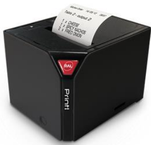
Abbildung 1 RCH PRINT! Thermo