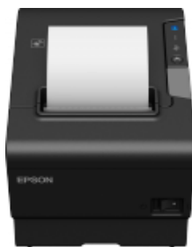
Abbildung 2 Epson TM-T88 Thermo